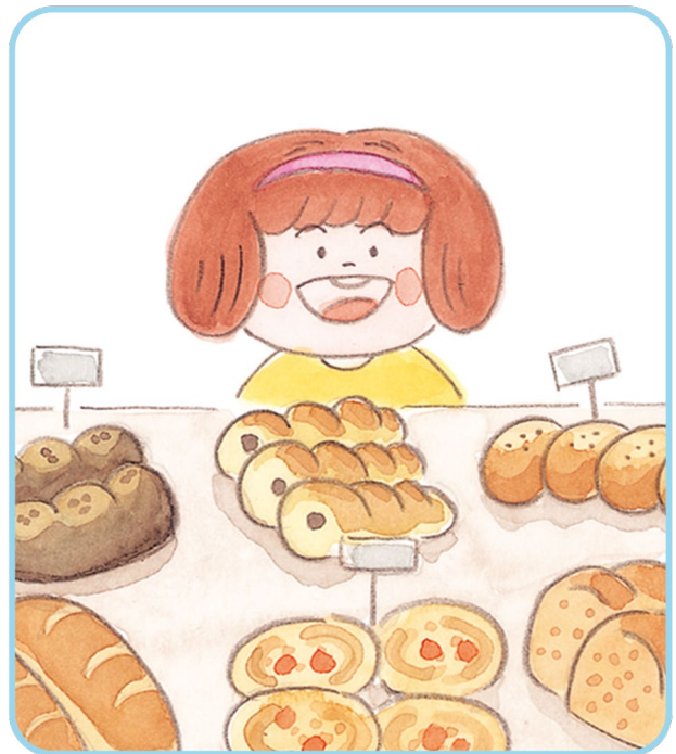
④ 제과점에 진열된 빵 몰래 만지기