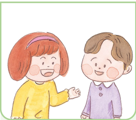
쉬는 시간에 혼자 있는 친구를 본 상황