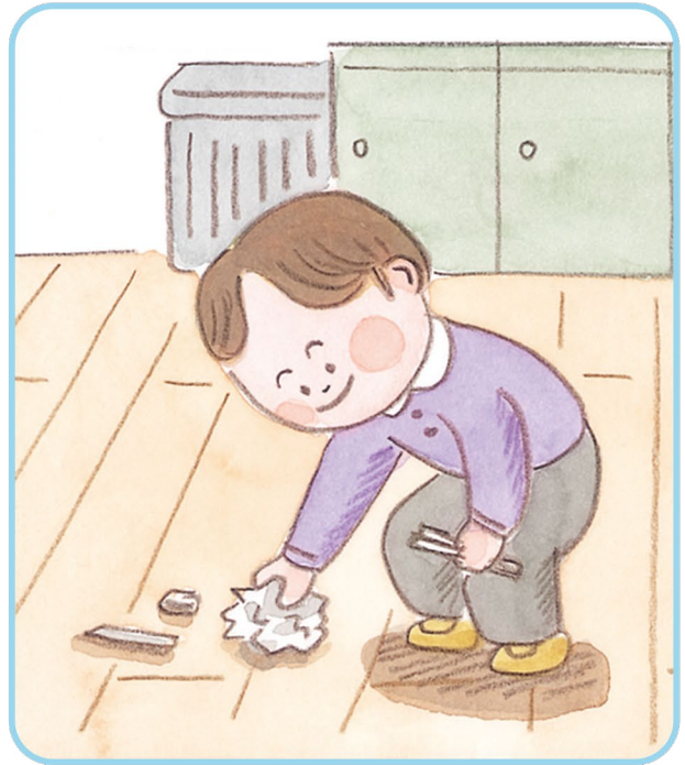
② 교실 바닥에 떨어진 쓰레기 줍기