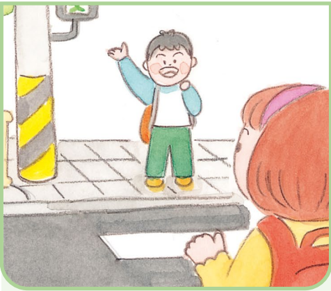
길에서 같은 반 친구를 만난 상황