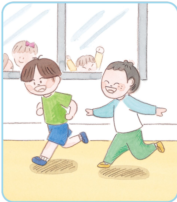
③ 복도에서 뛰어다니기