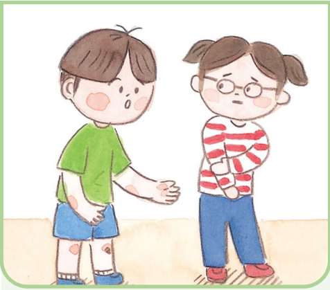
친구와 모르고 부딪친 상황

3. 친구에게 어떤 말을 건네면 좋을까요? 각 상황을 보고 적절한 말을 찾아 줄을 이어 보세요.