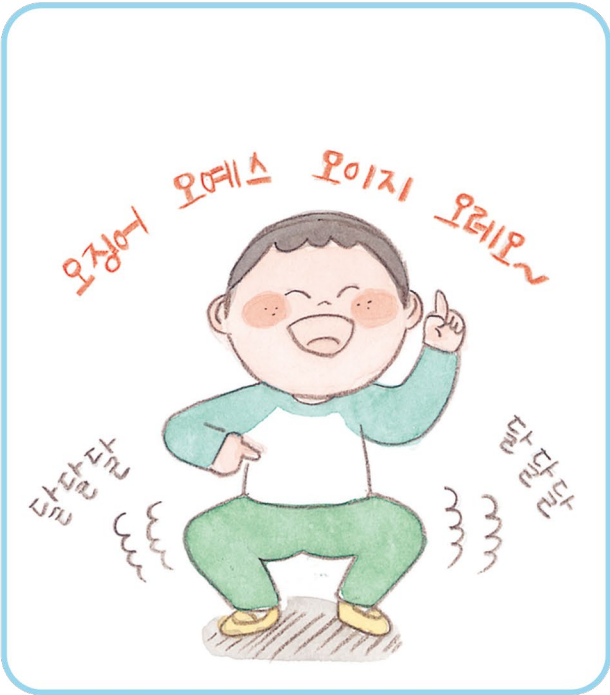
① 친구가 싫어하는 별명으로 놀리기