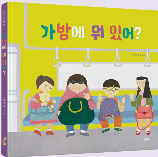
가방에 뭐 있어?