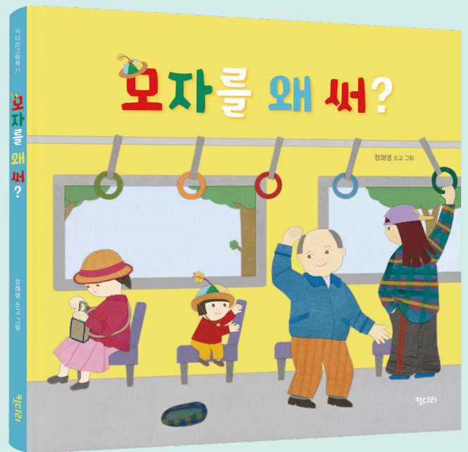
모자를 왜 써?