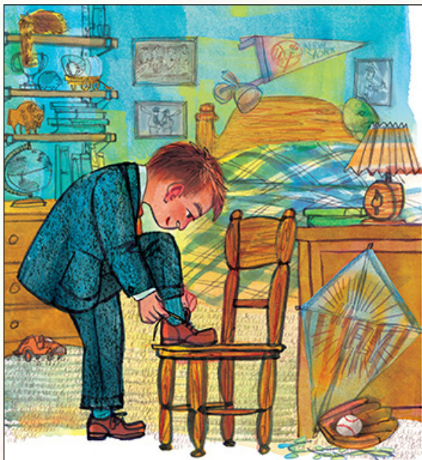
내가 너의 나이였을 때, 어느 토요일에 아치와 나는 생일 파티에 갈 예정이었어.