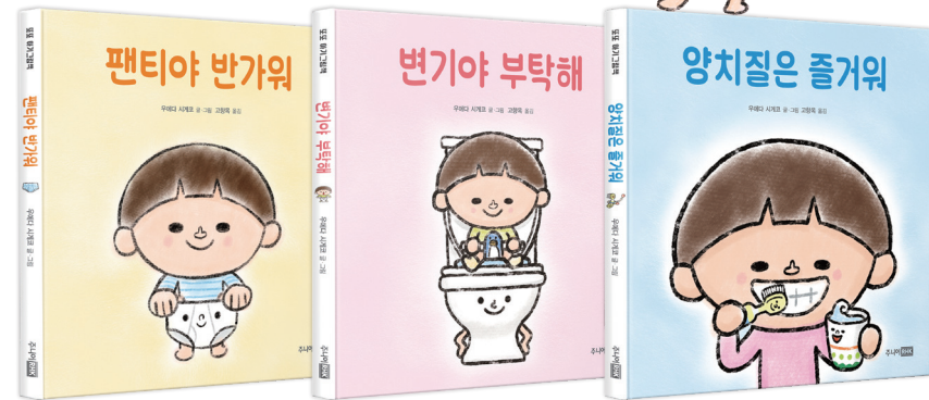
우에다 시게코 글·그림 | 고향옥 옮김

팬티를 입고 변기에 앉고! 치카치카 양치질을! 우리 아이 첫 생활 습관 그림책