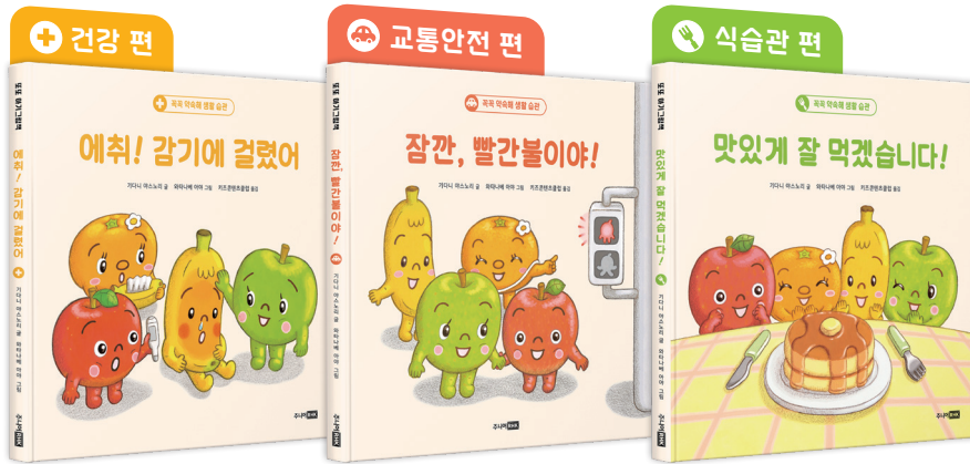
기다니 야스노리 글 | 와타나베 아야 그림 | 키즈콘텐츠클럽 옮김

아플 때는 꼭 쉬고, 빨간불이면 잠깐 멈추고, 밥 먹기 전엔 손 씻어요! 3-5세 필수 생활 습관 그림책