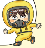
그림 속 뽕뽕 찾기