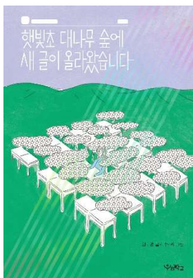
햇빛초 대나무 숲에 새 글이 올라왔습니다