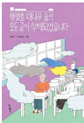
햇빛초 대나무 숲의 모든 글이 삭제되었습니다