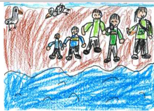
바다에 가서 형들이랑 놀았어요.