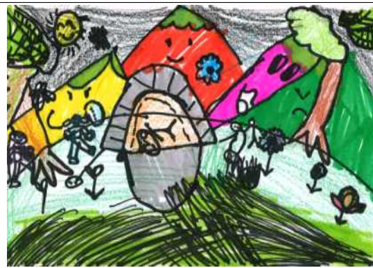
가족과 함께 캠핑을 했어요.