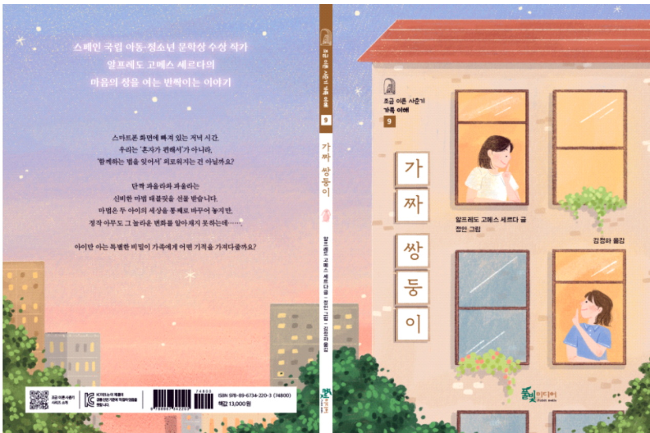
이미지-01_『가짜 쌍둥이』 표지(앞표지+책등+뒤표지)