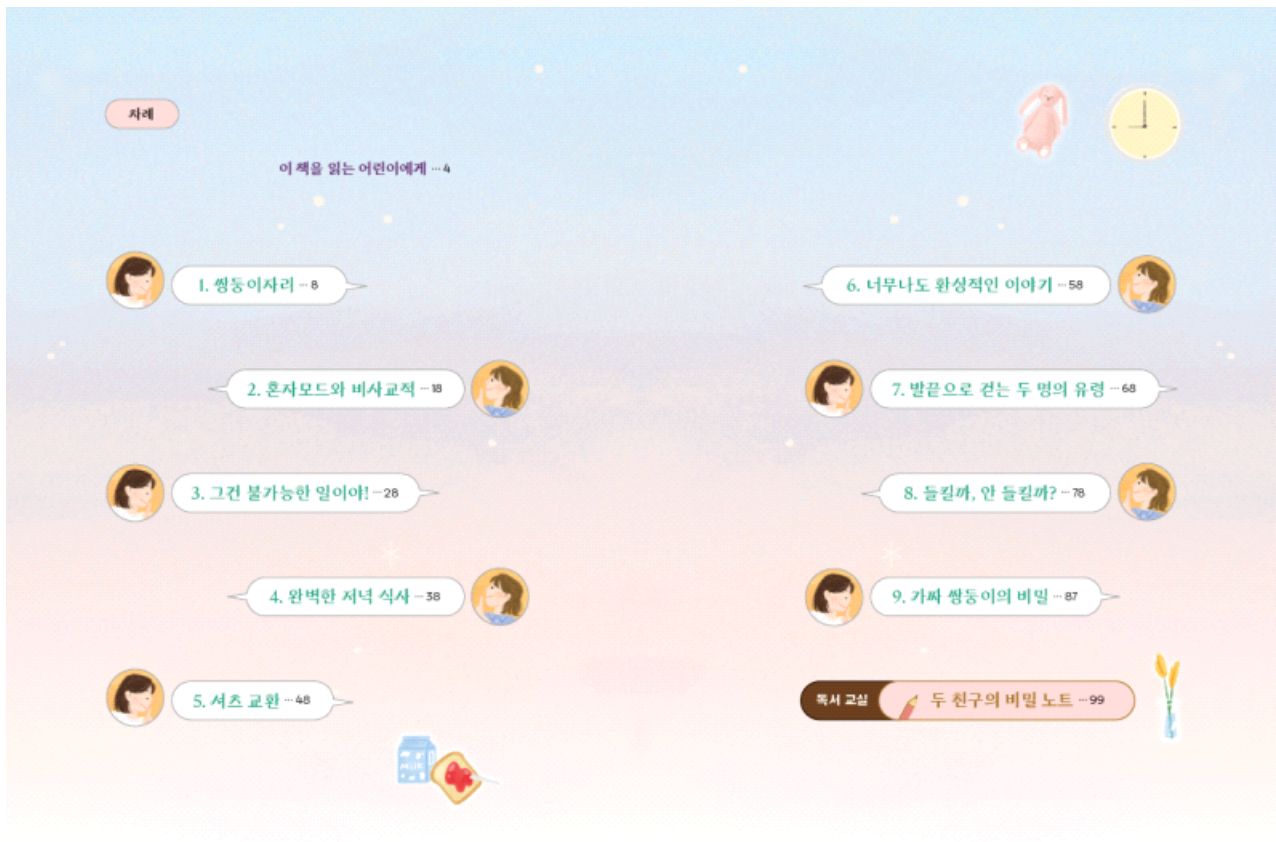
이미지-02_『가짜 쌍둥이』 목차