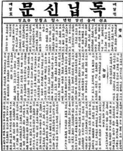
독립신문 창간호 1면

☆ 『독립신문』은 1896년에 발간된 우리나라 최초의 순한글 신문입니다. 서재필 선생님이 백성들에게 새로운 소식, 나라의 상황, 독립의 중요성을 알려 주기 위해 만들었습니다. 언문(한글)으로 쓰여서 백성들도 쉽게 읽을 수 있었지요. 지금 내가 만들고 싶은 신문이 있다면 어떤 기사로 백성들에게 말을 걸고 싶은가요? 어떤 이야기를 담고 싶은지 나만의 기사 를 써 봅시다.