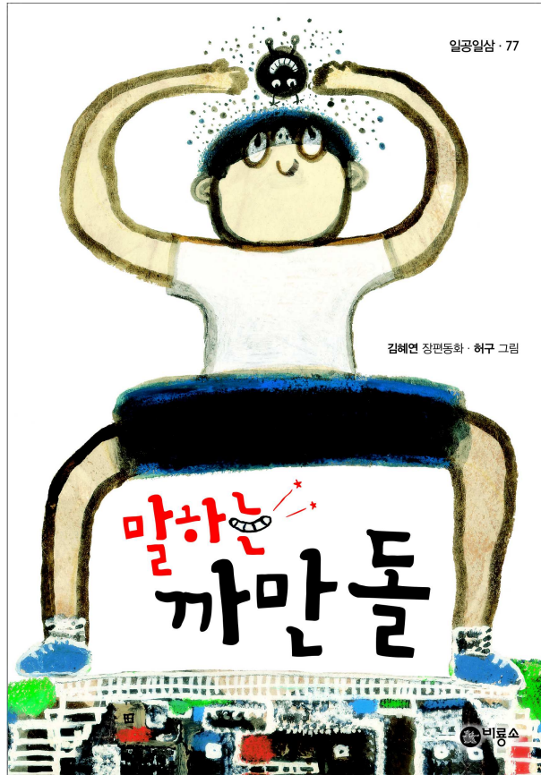
(표지 일러스트 © 허구)