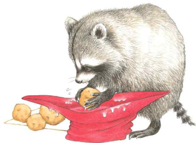
물통으로 쓸 수도 있어요.