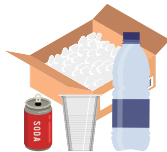
알루미늄 캔, 플라스틱 병, 스티로폼