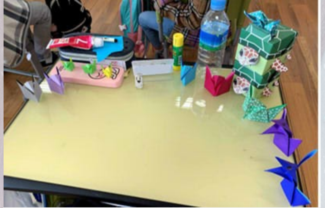
<예시> OO의 책상