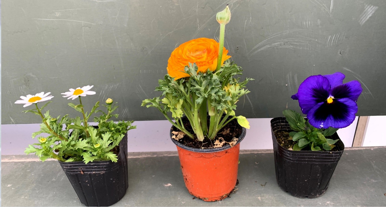
<예시> 세 가지 꽃의 화분