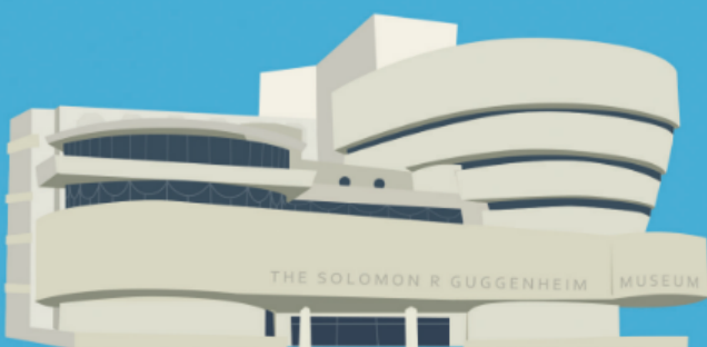
프랭크 로이드 라이트 미국 뉴욕 1956~59년 미술관