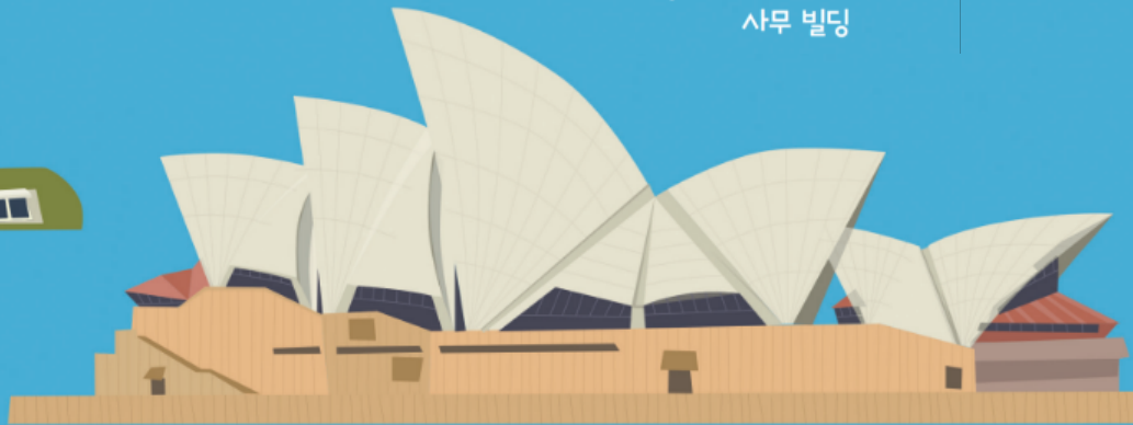
예른 웃손 오스트레일리아 시드니 1959~73년 오페라 극장