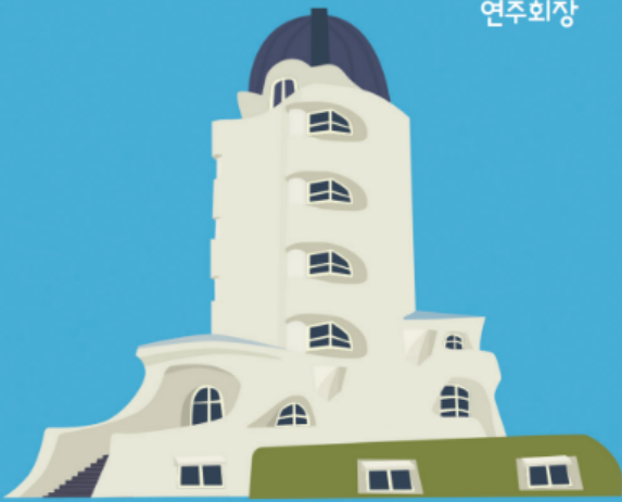
에리히 멘델존 독일 포츠담 1919~21년 천체 물리 관측소