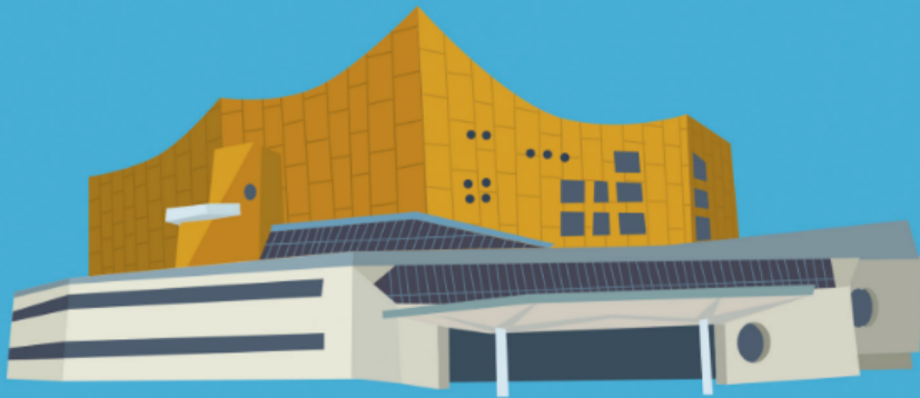
한스 샤로운 독일 베를린 1960~63년 연주회장

1. 다음은 시대 정신을 상징하는 세계의 대표적인 건물들입니다. 각 건물의 그림과 설명을 보고 건물의 이름을 찾아 써 봅시다.