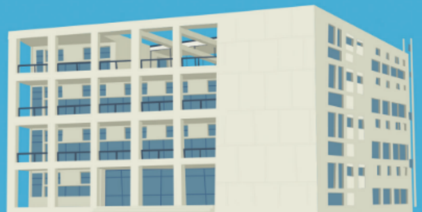
주세페 테라니 이탈리아 코모 1932~36년 정당 당사