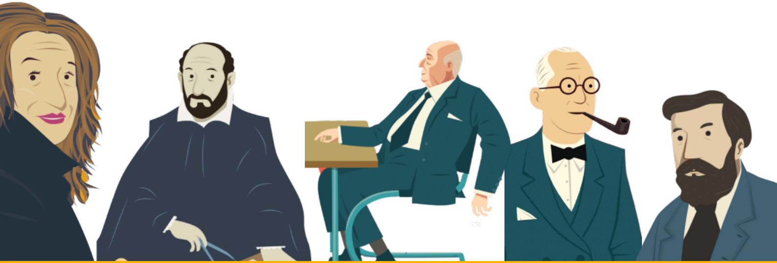
자하 하디드 안드레아 팔라디오 루트비히 미스 반데어로에 르코르 뷔지에 안토니 가우디

1. 다음은 책 속에 등장하는 건축가들입니다. 여러분은 어떤 건축가가 가장 기억에 남나요? 특별히 인상 깊었던 건축가의 건축물이 있나요? 한 인물을 골라 여러분이 그 건축가가 되었다고 상상해 보고, 책을 참고하여 아래의 소개글을 써 봅시다.