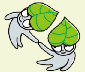
화초: 휘카스 움베르타