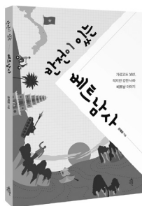
반전이 있는 베트남사 가깝고도 낯선, 작지만 강한 나라 베트남 이야기 권재원 지음 | 168쪽 | 13,000원