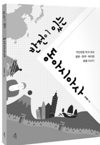
반전이 있는 동아시아사 색안경을 벗고 보는 일본·중국·타이완·홍콩 이야기 권재원 지음 | 216쪽 | 13,000원

대한출판문화협회 ‘올해의 청소년 교양도서’ 책으로따뜻한세상만드는교사들 추천도서 학교도서관사서협의회 추천도서 행복한아침독서 추천도서