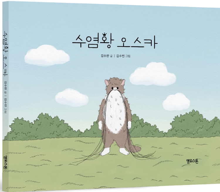
김수완 글/김수빈 그림