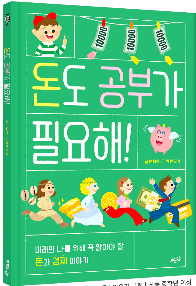
안재욱(경희대 경제학과 명예교수) 글 | 민유경 그림 | 초등 중학년 이상

사회 4-2 2.필요한 것의 생산과 교환 실과 5-2 5.나의 자립적인 생활 관리 사회 6-1 3.우리나라의 경제 발전