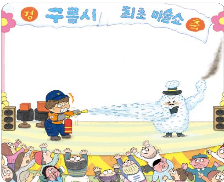
( 본문 22-23쪽 )