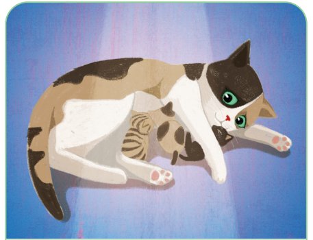
꼭지에게 일어난 일