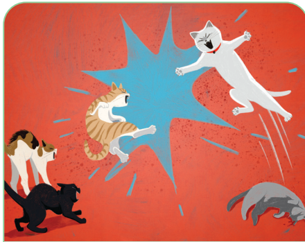
꼭지에게 일어난 일