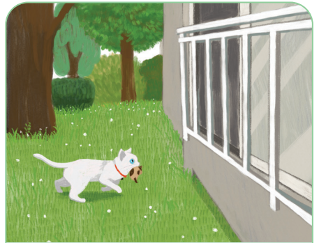
꼭지에게 일어난 일