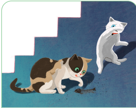
꼭지에게 일어난 일

꼭지가 사월이를 따라 집 밖으로 나왔다가 단비를 만났. 단비는 꼭지가 집고양이라는 사실을 알고 친구가 되고 싶지 않다고 함.