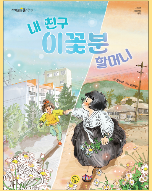
김우정 글 | 최정인 그림 | 책따지 펴냄