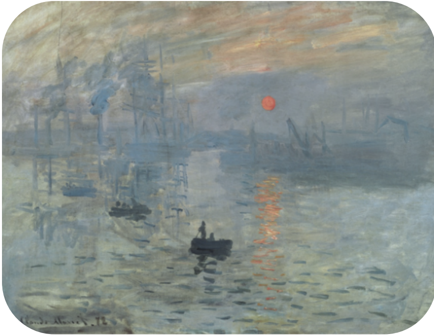
모네의 <인상, 해돋이>(Impression, soleil levant, 1872, 마르모탕 모네 미술관)

하늘은 무슨 색일까요? 아마 다들 '하늘색'이라고 대답하겠지요. 그런데 여기 이 그림을 보면 하늘은 여러 가지 색이에요. 분홍색도 있고, 노란색도 있고, 주황색도 있네요.