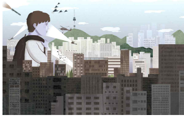
# 사람들이 아이를 공격하다

1. 아이는 자라고 자라서 건물보다 커져요. 사람들은 아이 모습에 놀라 도망을 가고, 아이를 향해 돌멩이와 폭탄을 던져요. 사람들이 그렇게 행동하는 이유가 무엇인지 생각해 볼까요?