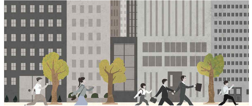
# 같은 모습의 사람들

2. 아래 그림에서 주인공은 누구일까요? 주인공을 찾아 ○ 하고, 주변 사람들과 어떤 모습이 같은지도 이야기해 보아요.